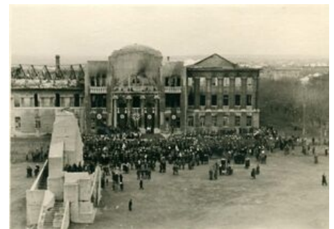
Бахмут во время оккупации немцами