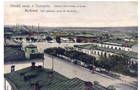
Бахмут в 19 веке