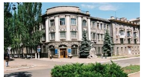
Бахмут до войны с Россией