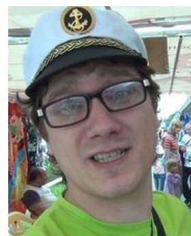
Самопровозглашённый адмирал-генерал «Омской Армии»