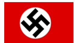
Лысые боны тоже одобряэ.

Много говна в интернете вылито на тему того, что фашизм и нацизм — не одно и то же. Если коротко, то фашизм столько же, сколько и самих фашистов , и далеко не все из них запрещены законодательно.