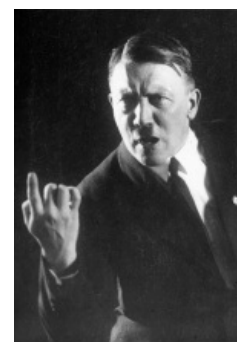
Объект лютого флюордроса сабжа.

Через неделю после краха на Уолл-стрит в октябре 1929 г. вся Веймарская республика полетела к чертям. Без работы мгновенно остались шесть миллионов человек, то есть примерно пятая часть всех работоспособных. Правящие социал-демократы и католики не могли решить имеет ли смысл урезать пособие по безработице, фельдмаршал Гинденбург распустил парламент. Новый канцлер Брюнинг пачками резал расходы на социальное страхование, государственных служащих и зарплату, а мелкий бизнес обложил налогами, отчего многие бюргеры вновь оказались у разбитого корыта, и им срочно нужно было найти, кто виноват. Вот тут Гитлер со своими рассказами про сридов оказался исключительно кстати. В глазах лавочника большой бизнес, евреи, демократия, социал-демократическое правительство и марксизм слились в одну черную дыру — в заговор против самых трудолюбивых не таких, как все . На выборах, состоявшихся 14 сентября 1930 года, за НСДАП голосует 6,500к населения. Из самой маленькой партии в рейхстаге она стала второй, набрав 18,25%.