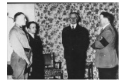
Тот его одобряэ!

Но Адик вовсе не хотел ни с кем делиться властью. Он пытается стать канцлером, Гинденбург дважды ему отказывает, говоря, что «такому человеку он бы максимум почтовое отделение доверил». Но с третьей попытки Гитлер таки уговаривает Гинденбурга. Секрет в том, что в то время у Адика уже была очень эффективная организация под названием « ЛЛ », выяснившая, что сын Гинденбурга уклоняется от налогов. Став канцлером, Адик пробивает закон о чрезвычайных полномочиях (из-за очень кстати сгоревшего Рейхстага ), и благодаря ему начинает делать все, что захочется. Как видите, ни на одних выборах нацисты не получили более 33 процентов.