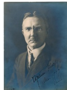
Сабж собственной персоной.

Ялмар Шахт (фаш. Hjalmar Horace Greeley Schacht) — Истинный полукровка (Родаки по маминой линии - датчане), сын истинных поросят Петров, ВНЕЗАПНО деятель Фатерлянда, президент Рейхбанка, рейхминистр экономики (Фактически рулил гешефтом!). В истории запомнился как создатель национал-социалистической системы, которая хоть и соснула совкового хуйца в силу нежизнеспособной экономической структуры, но переломила кучу европейских унтерменшей. Был выпилен на трибунале? Не-а! 8 сопливых лет на каторге отбывал и свалил в ФРГ (Западная Гермашка), так как Большое Зло пало, а Меньшее - осталось. И жил долго и счастливо, пока не каза болду в 1970. Обо всем по порядку.