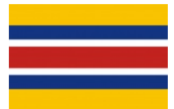
Эти ребята тоже хотели сверхдержаву.

С другой стороны, ярый монгольский националист, Чойбалсан никогда не оставлял надежды объединить всех монголов под эгидой Монгольской Народной Республики. До 1945 года он поощрял этнический мятеж в Восточном Синьцзяне (при поддержке Сталина), стремясь усилить влияние МНР в регионе и, возможно, за его пределами, до Ганьсу и Цинхая. Он рассматривал надвигающееся поражение Японии как возможность реализовать свою давнюю мечту о "Великой Монголии", объединении Внешней и Внутренней Монголии, и он полностью ожидал поддержки Сталина в качестве награды за непоколебимую поддержку Монголией Советов во время войны. Начиная с 1938 года, Чойбалсан вызвал кратковременную волну панмонгольского национализма через прессу, призывая к объединению и поощряя массовое панмонгольское движение во Внутренней Монголии. Но 10 августа 1945 года настал долгожданный момент и Монголия объявила войну Японии через два дня после того, как Советский Союз и обе армии объединили усилия для атаки японских укреплений на севере Китая в ходе Маньчжурской стратегической наступательной операции. А когда Хорло приказал монгольским войскам драпать до Чжанцзякоу, Чэндэ и Бату-Хаалга, разгневанный Сталин приказал ему отозвать их. Не получилось, не фортануло, трубача не интересовал свидомый пиздеж про единство, так что это ознаменовало постоянное разделение великой Монголии на независимую Монгольскую Народную Республику и соседнюю Внутреннюю Монголию. Чойбалсан испытал баттхерт, от которого оправится не смог.