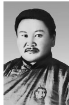
Гэндэн умерен и ссыклив.

Дальше Сосо приказал нынешнему Пэлжидийну Гэндэну вырезать на территории МНР духовенство Далай-ламы. Но тот, ахуев от вооруженных восстаний из-за радикальных реформ, всячески препятствовал этому. Умеренность Отцу Народов не устроило и решил его сменить. Действуя по директиве Москвы, Хорло в марте 1936 года провел чистку Гэндэна за саботаж монгольско-советских отношений, отклонив требование Сталина ликвидировать буддийское духовенство страны. Судьба была не завидна: Гэндэн был арестован и отправлен в Москву, где год спустя выпел йаду. А Хорло стал анальным повелителем МНР.