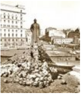
Почти Пол Пот.