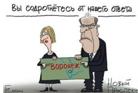
Примерная концепция (by Елкин)

«Бомбить Воронеж» — не первый свежести мем, зародившийся после войны с Грузией в 2008 году и активно разошедшийся по этим вашим инторнетам в эпоху российских «антисанкций», когда в ответ на различного рода европейские запреты, связанные с отжатием Крыма, российские чиновники с мужественными лицами и слегка коричневыми штанами гордо запрещали ввоз сыров, хамона, молока, мяса и всего того, что внутри страны толком не производилось и било в первую очередь по сонному обывателю, а не по проклятой и загнивающей. Словарное определение термина — санкции, которые наносят больше вреда тебе самому, а не тому, кто под эти санкции попал.