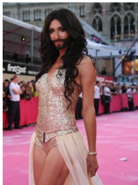
То самое существо