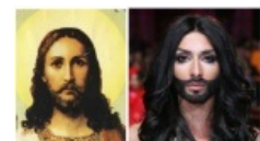
Правило 63 в действии