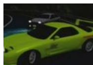
Один из кульминационных моментов первого сезона - Дуэль Такуми (на Тойоте) с Кэйсукэ Такахаси (на Мазде RX-7)