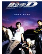
Обложка гонконгского издания фильма