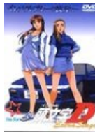
Обложка DVD OVA Extra Stage 1