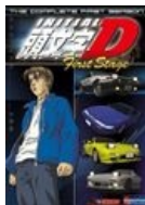
Обложка американского издания первого сезона