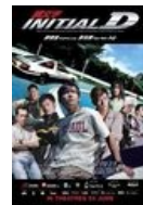
Постер кинофильма с китайскими актёрами