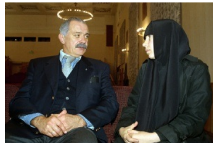
Михалков с подобающим статусу аксессуаром

Родился в столице России 21 октября 1945 года в семье известного детского писателя, а также автора гимна бывшей Великой Империи Сергея Владимировича Михалкова. Несмотря на явное расположение советской власти и огромное количество наград и привилегий от оной (и у отца, и у сына), после распада СССР Михалковы стали публично заявлять о своем непролетарском происхождении: непонятно откуда взявшемся множестве предков — титулованных особ, среди которых есть даже действительный статский советник. Оно и понятно — не пристало человеку с таким самомнением иметь предков-простолудинов. Рассказы о тяжелом детстве, горестях и нужде, которые пришлось испытать в детстве, Михалков не раз смаковал в интервью. Именно так он объясняет происхождение своей безмерной жадности. Благодаря известному и влиятельному папочке Никита еще с детских лет начал сниматься в кино, поэтому неудивительно, что ему удалось успешно окончить режиссерский факультет ВГИКа в 1971 году. Тем не менее, связи отца, очевидно, не смогли спасти его от призыва на срочную воинскую службу, и в 1972 году Михалков-младший отправляется на камчатский флот. В многочисленных интервью Никита Сергеевич харизматично разыгрывает героя, служившего подводником на Тихоокеанском флоте. И все бы ничего, но указанное им судно числилось в то время в составе Черноморского флота и было вовсе не подводной лодкой. Что ж, как говорил о Михалкове Владимир Высоцкий: «Всё наврал, а как интересно!»