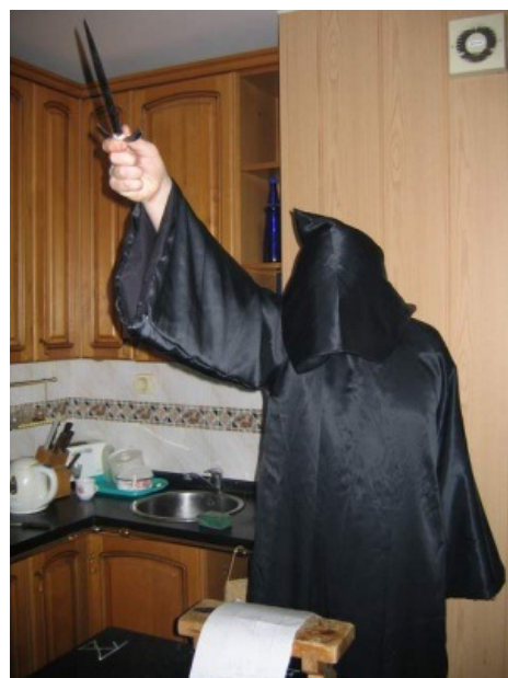
Снова на сцене появляется кЫнжал с намоточной рукоядью.