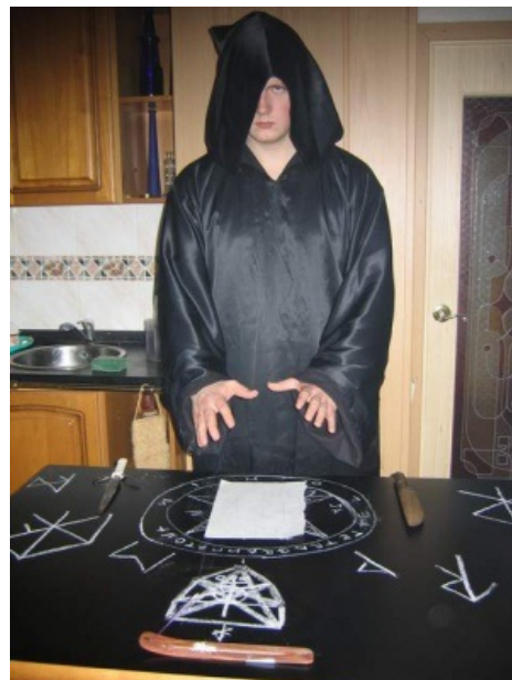
Главное в ритуале — напряженное выражение лица (когда фотографируют).