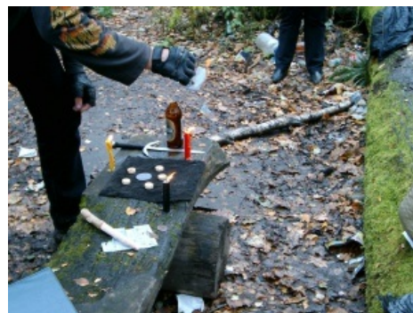
Валарат проводит ритуал прАклятия, используя Силу Клинского Пива и Ножика с Намоточной Рукоядью!