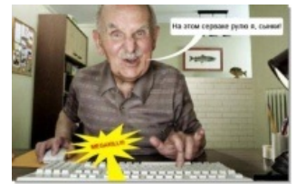
Даже в старости.

Занят просмотром аниме и прочими принятыми в аниме-тусовке делами. Достаточно социализован,