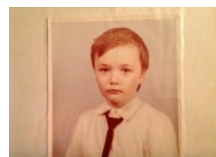
Вырасту — стану блядвой!