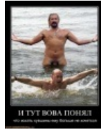
и по отдельности