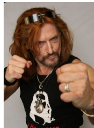
Русский Чак Норрис в наступлении