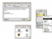
Тёплая ламповая аська