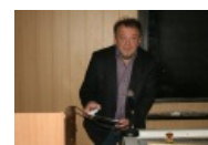
Полупьяный диктор, чем-то похожий на Джека Николсона