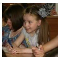
Лоли тоже хотят стать GN