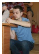
Ещё один писатель на коленках