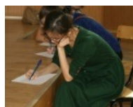
И даже так его пишут