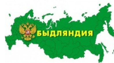
Возможное современное именование Этой страны.

Исторически Эта страна существует достаточно давно и берет свое начало в глубине веков. Отнюдь не ради красного словца следует признать, что у нее бывали и взлеты, и падения, и не всегда мрак царил на ее территории. В лучшие годы своей государственности она горделиво примеряла на себя звание империи и носила имя то России, то Советского Союза. Долго ли, коротко ли неумолимые энтропийные процессы берут свое, все хорошее заканчивается, и последнее летописное упоминание о достославных временах Этой страны датируется 1991 годом. СССР приказал долго жить, Россия погибла еще в 1917, и неожиданно оказалось, что у Этой страны не осталось вообще никакого приемливого названия.