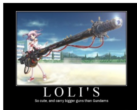
Анимешные героини, они такие, да.

Впрочем, особенностей у аниме слишком много, и пытаться описать их в одной статье бессмысленно. Интересующиеся могут пройти по ссылкам из шаблона в самом низу статьи и почитать про особенности направлений аниме и анимешных типажей по отдельности.