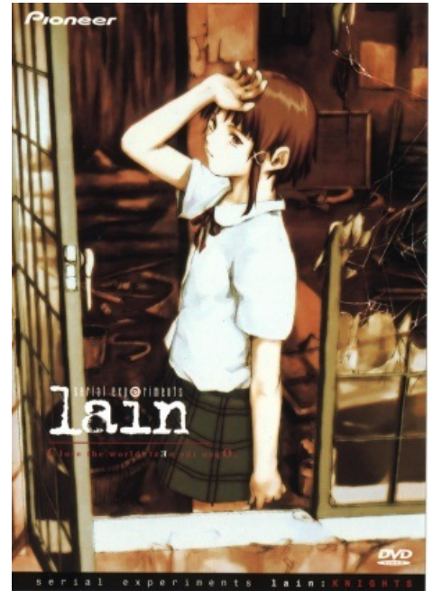
Serial Experiments Lain.

Truefrit: Насмотришься "Эксперименты Лэйн", выходишь на улицу мусор выносить - а там везде ПРОВОДА.