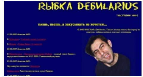
Рыбец образца 2001 года

Часто описываются просто события, с которыми автор столкнулся на улице, по пути. И поиск глубинного смысла. Но ненависть чаще всего обоснована, автор старается показать проблемы и пороки нашего общества, на примерах, с которыми столкнулся здесь и сейчас, зачастую прямо на улице. Он не ставит цель спасти кого-то от чего-то, улучшить общество, каждого в отдельности. Просто рассказывает и рассуждает. Выводы остаются за читателем. Существовало немалое количество поклонников данного вида творчества, да и сейчас их немало (см ЖЖ).