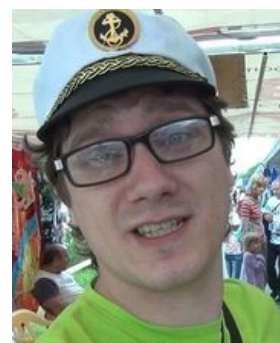
Самопровозглашённый адмирал-генерал «Омской Армии»