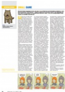
Мэтр заявляет о намерениях