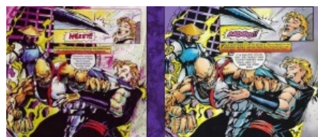
Комикс по Mortal Kombat. Найдите два отличия