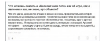
Корнеев о «Бесконечном Лете»