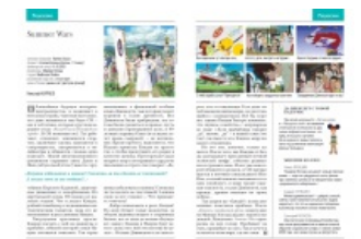
...и пересказ сюжета