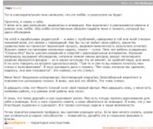
Мэтр строит амбициозные планы