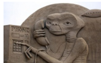
Уэстонский фестиваль песчаных скульптур, 2013 год