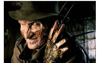
Раз-два, Фредди заберёт тебя. Не спи!

Один из самых популярных ужастиков за всю историю кинематографа. Маньяк Фредди Крюгер убивает подростков, живущих на улице вязов. Суд его оправдывает за недостаточностью улики. Тогда родители убитых подростков выслеживают его, обливают бензином и сжигают заживо. Но Фредди не умер, а стал ещё страшнее, теперь он преследует подростков во сне. В этом главная фишка фильма, сделавшая его популярным: убитый им во сне умирает по-настоящему. Снят по каноническому сюжету, Фредди выслеживает подростков во сне по одному и убивает всякими хитроумными способами, пока наконец оставшаяся в живых девушка не убивает его каким-нибудь не менее хитроумным способом. После чего он оживает в следующей серии, убивает девушку из предыдущей, и всё повторяется. В общей сложности было снято девять фильмов, нарисовано пять комиксов, выпущена книга и несколько компьютерных игр.