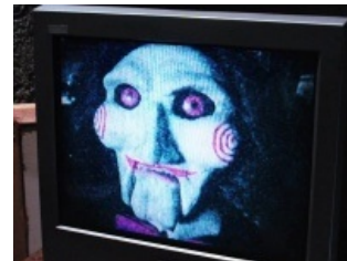
Пила смотрит на тебя, как на очередную жертву. Берегись!

Самый страшный ужастик если не в истории жанра, то за последние пару десятилетий это точно. Маньяк устраивает жертвам игру на выживание. Чтобы выжить в игре, надо совершить что-то довольно мерзкое, например конкретно искалечить себя или другую жертву. Жертвы выбираются не случайно, а те, кто в прошлом жил неправильно, с точки зрения Пилы. Обычно это злодеи, избежавшие суда, или неудачники. Пила — смертельно больной человек, который начал ценить жизнь только когда столкнулся со смертью, этим же он наставляет других на «путь истинный». Прошедшего маньяк честно отпускает на свободу, считая что теперь этот человек заслужил право на жизнь, проигравший помирает в мучениях. Разумеется сюжет построен так, что до конца фильма испытаний не может пройти почти никто. Фильм построен на флешбеках в лучших традициях детективного жанра, очередные ответы (и ещё больше новых вопросов) зритель получает в самом конце очередного фильма.