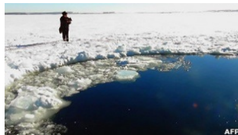
Небольшая дырка во льду

Основная часть обломков находится в озере Чебаркуль, куда метеорит приземлился, пробив внушительных размеров полынью. Более мелкие разлетелись при взрыве, часть из них собрана учеными и местным населением. Подъем крупных обломков в настоящее время отложен до зимы 2014 года по информации ВВС [3] По предварительным исследованиям большая часть обломков находится глубоко в иле озера и их подъем связан с неоправданными расходами и рисками. А лишнего бабла у муниципалов просто нет, да и гешефт не предвидится.