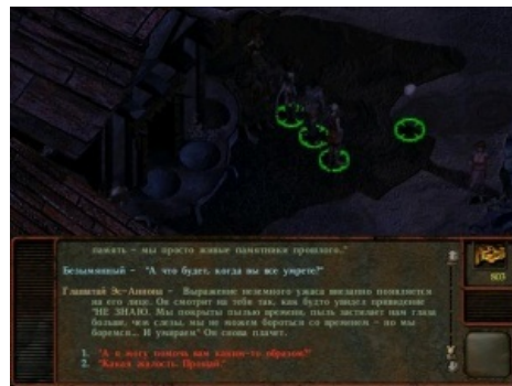
Planescape: Torment. Слезы Глашатая Эс-Аннона

По ходу действия вам повстречается персонаж Глашатай Эс-Аннона, который будет слезно умалять вас поставить памятник своему городу, а после диалога еще с одним NPC, который расскажет вам о опасности именем и происках кровавой гэбни , вашего героя осенит что нужно для этого сделать.