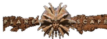
Planescape. Логотип сеттинга.