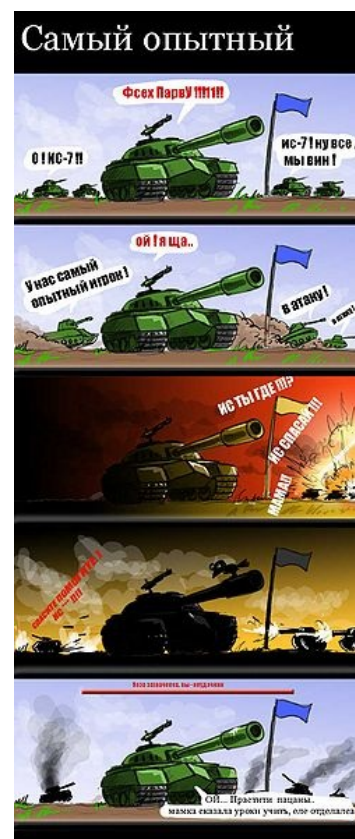
И такое бывает.

Приходят в игру с одной целью — ногебать. Активно вливают реал в прокачку, снаряды и расходники, качают ту технику, которая (по словам форумных экспертов/гуру) ногебается. После прокачки вайнят, что не ногебается (прямые руки за реал не купишь). После патча с очередным ребалансом срут кирпичами, заваливают форум воплями и качают новых ногебаторов, чтобы продать их после следующего патча. Основной источник заработка разработчиков.