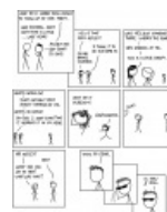
xkcd: Это Рик Этли, детка