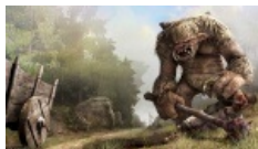
А это злой и голодный.