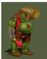
Сытый и довольный тролль.