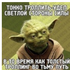
Йода знает толк в троллинге.