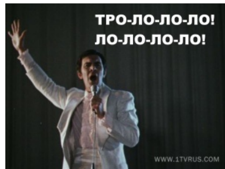
И Муслим Магомаев тут как тут

Еда — ответы, внимание, которого хотел тролль. Выдается маленькими порциями, иногда копипастами, объемом с неплохой рассказ. Может содержать ненависть, наставления, разъяснения. Бан тоже еда, тролль горд, что до его персоны снизошел модератор. Часто пытается обжаловать бан, порождая еще больше лулзов. Вкусная еда — те ответы, которые показывают лицо отвечающего без прикрас, показывают его мнение и отношение к вопросу, без альтернативных точек зрения, либерализма, наукоемких слов. Также вкусная еда именуется жиром (именно через ы , в отличие от свиного жира).