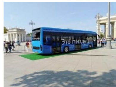
А ведь правда

Сабж подвергся массовой НЕНАВИСТИ со стороны транспортных фанатов, экспертов и простых горожан. А все потому, что мэр Москвы решил закрыть в городе троллейбус, сеть которого была крупнейшей в мире. Со своим непреодолимым желанием попилить бабла Собякин объявил своему народу, что «троллейбус устарел, медленный, долго поворачивает, а контактная сеть портит вид города». С 2014 по 2020 год троллейбус был полностью выпилет. И все же ССС сжалился над троллейбусофагами и оставил только один «музейный» маршрут вокруг Казанского вокзала, остальные провода начали резать, а подвижной состав — передавать в другие города (к сожалению, Питера среди них не оказалось, есть версия, что столица вебкама отказалась от них сама).