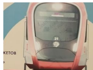
Мнение пассажиров Таганско-Краснопресненской Линии об этом вашем МЦД

Общественный транспорт — самый огромный пункт в политике сабжа, прямо вытекающий из предыдущего. Как же людям перемещаться по городу, если метро далеко или на нем можно дать нижерового кругаля? Пользуясь своими наворованными богатствами, ССС начинает массивное строительство станций метро, несмотря на то, что развивать наземный транспорт в 9000 раз дешевле. Политика строительства, как всегда, вызывает особый интерес, начиная с того, что часть станций была построена прямо в чистом поле (это как раз про «Новую Москву») и заканчивая тем, что местоположение станций в принципе выбирается по принципу как можно большего покрытия без учёта текущей нагрузки действующих линий. Так, Некрасовская линия, призванная окончательно разгрузить многострадальную станцию Выхино, справляется с этой задачей чуть менее, чем никак, так как пересадку на перегруженную ТКЛ заебали прямо перед Выхино.