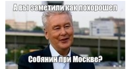
Собянин рвёт все шаблоны

Сергей Семёнович Собянин (стол. Сугроб Бордюрович Собакин; он же Канальгерух [1] , CCC, AssAssAss, Оленевод, Собако(в)ед, Плиточник, Похорошевший, Хантыманс, Самоизолятор) — третий бургомистр Default City , унаследовавший удел от Старика Батурина , кикнутого Димоном из-за «утраты доверия». Преобразователь Мацквы в современный еврейский европейский мегаполис с плиточкой и платными парковками. Является предметом лютого обожания среди фанатов одной известной партии и не менее лютой НЕНАВИСТИ среди коренных урбанистов.