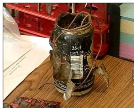
Аццкая машины смерти, созданная юннатами