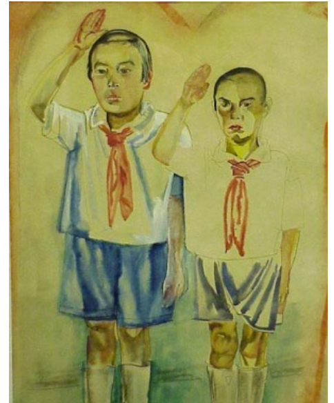
Собирательный образ советского пионера