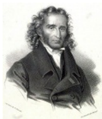
Никколо Паганини. Гравюра 19 века.