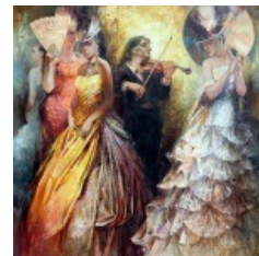
Игорь Жарков. Никколо Паганини.