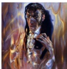
Александр Маранов. Никколо Паганини.