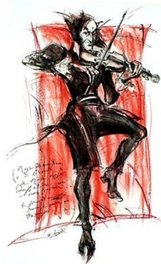
Гений в представлении миролюбивых христиан.

Все лучшее и высокое в мире связано с христианством. Лучшие музыканты нашего века пишут церковные гимны. Нет ни одного классического композитора, который не писал бы оратории и мессы. Реквием Моцарта, оратории Баха, мессы Генделя свидетельствуют о том, что господь не оставляет Европы и что вся наша культура строится на началах христианской любви и милосердия. Но вот появился скрипач, который сворачивает с этой дороги. Всем своим поведением, ненасытной алчностью, упоительным ядом земных соблазнов Паганини сеет тревогу на нашей планете и отдает людей во власть ада. Паганини убивает младенца Христа.