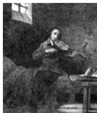
Louis Boulanger Paganini in Prison, 1831.