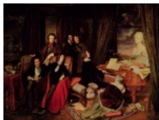
Йозеф Данхаузе. 1840 год.