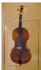
Скрипка Паганини работы Гварнери.