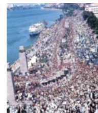
Сегодня мы будем проводить поминки!

Принял ислам наш ГГ 28 сентября 1970-го года. И нет, никто его не выпилил. Он сам помер от сердечного приступа. Не все же доживают до зимы. Похоронили сабжа в пафосном мечети его имени, разумеется. Но для арабского мира и самого Египта, смёрть Господина — это большой ахуй! Ведь он боролся за будущее арабов мира всего и потерять такого презика — смерти подобно.