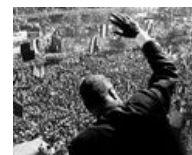
Арабы уважают своего Господина!

Совок, видя в Израиле ещё одну прозападную НЁХ, начал сблизиться с арабами. И тут Египетский Властелин, произнеся пафосную мантру «Сбросить Израиль в море!», фактически захотел через блокаду спровоцировать Израиль на ещё одну маленькую победоносную войну, умножив таким образом это осиное гнездо на ноль. Но война оказалась не победоносной вообще. А это всё потому что насеристы просчитались, что жида ничего не заметят и ни чем не успеют ответить (Авось, имя нам Легион и они долго не продержатся). Жида сделали ход конём, напали первыми и захватили весь Синай, Сектор Газа, Голанские высоты и западный берег реки Иордан.