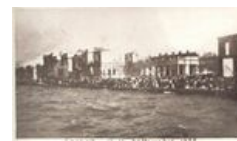
Былинный отказ греков... Проеб Смирны.

Внимание, сабж внезапно возобновил наступление. Битва при Думлупынаре — это винрарнейший успех сабжа, который перечеркнул нахрен блицкриг греков по взятию 3 немалых города. Пока греки деградировали, турки угодили ни в чём не подозревающую армию в котел, отрезав от Смирны. И таки попячили её нах! А в чём вин? В результате разгрома был взят в плен только что назначенный главкомом греческой армии генерал Трикупис со своим штабом [15] . Греческое правительство после сдачи Эскишехира ушло в отставку, греки пытались обеспечить по крайней мере эвакуацию Смирны. Почти одновременно был отдан приказ об оставлении всего малоазиатского плацдарма и сворачивать свои амбициозные планы нахуй.