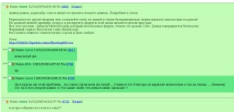
Типичный тред в /b/