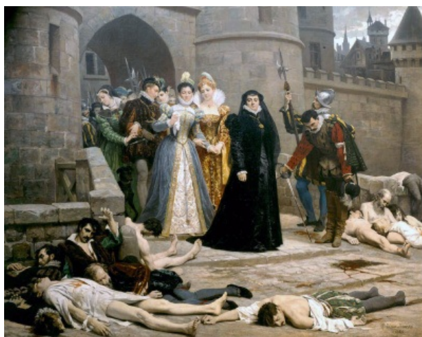
Королева-мать смотрит на тебя, как на убитых