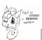
Всякая фуррятина на тему