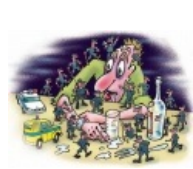
Белочник сферический в вакууме