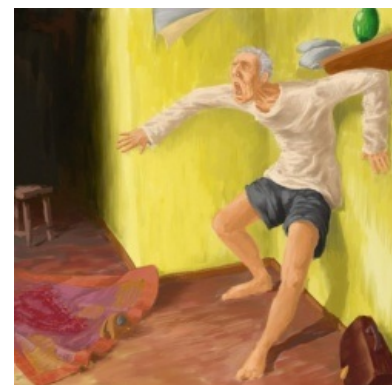
Собственно алконавт, поймавший D.T.

Белая горячка («белка», «белочка», «белуха», «дэтэха», «дэтешка», в медицине «delirium tremens» или «алкогольный делирий», совсем уж по-научному «синдром отмены алкоголя с делирием» или просто «допился до чёртиков») — острое психическое расстройство, возникающее у алкоголиков после резкого выхода из запоя. Сопровождается живописными глюками и бредом непредсказуемого изменчивого содержания.