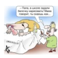
Самый распространённый вопрос детей к своим папам