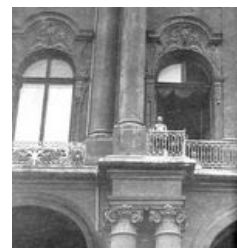
Коленька кайзера посылает прямиком нахуй.