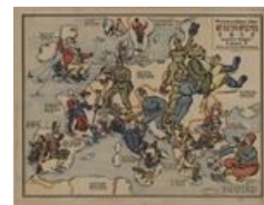
Карикатурная мировая войнушка.

1 августа 1914 года кайзер объявил войну поддерживавшей братушек-славян России, а заодно без объявления войны напал на Люксембург. После этого он потребовал у Бельгии пропустить фрицев к французской границе, предварительно объявив войну Франции. Бельгийский король начал артачиться и не в меру раскукарекался, и тогда кайзер предъявил Бельгии. Франция попросила помощь Англию, поняв, что сейчас немцы начнут люто, бешено петушарить хрэнцузов, но Англия объявила о нейтралитете, кинув