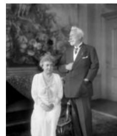
Нидерланды, 1933-ий год

тем, что те его не выдали как военного преступника. И Второй Рейх прекратил своё существование.