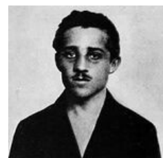
Сербский задрот успел войну развязать, а ты сиди дрочи в свои игрушки.