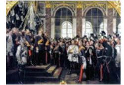
Короновался Кайзер во Франции, а не во Втором Рейхе.

13) НАКОНЕЦ-ТО , Париж капитулировал! До 28 января Париж бомбардировали из крупнокалиберных орудий. Всего за несколько дней городу был нанесён ущерб больший, чем за все предыдущие и последующие осады. В ходе бомбардировки погибло 400 парижан. 28 января город окончательно капитулировал.