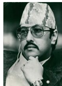
Он ещё не знает, что его пристрелят.

В 1990 году активизировалось массовое Движение за восстановление демократии, основными участниками которого был Непальский конгресс и коммунистические группы. После нескольких месяцев ожесточённых столкновений на улицах Катманду, в которых погибло более 800 человек, король Бирендра попытался замаять бурление говен: Распустил панчатскую систему, легализовал политические партии и отказался от абсолютной власти. На выборах 1991 года Непальский конгресс получил 37,7% голосов, три коммунистические группировки – 36,5%. Правительство возглавил председатель Непальского конгресса; в правительство вошли представители коммунистов. Тогда же большинство марксистских группировок объединились в Коммунистическую партию (единую).