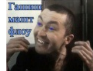
Арташ машт флоу Гашиш машт флоу