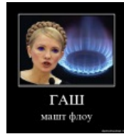
Гаш машт флоу