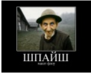
Шпайш машт што?