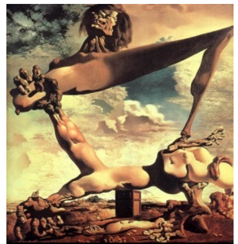
Мягкая конструкция с варёными бобами