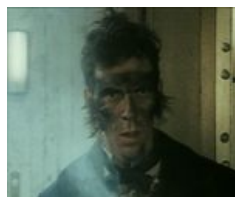
Восставший из Ада.