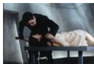
О да, он знает как обращаться с женщинами.