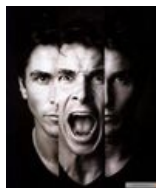
This is TETRAGRAMMATON