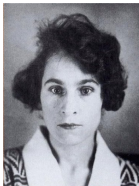
Вот она, муза целых троих великих творцов прошлого века

Потом в жизни молодой пары (и зачастую в постели Галы) появился сюрреализм , придуманный остроумным, но, по мнению большинства искусствоведов, абсолютно бездарным поэтом Андре Бретоном. Кроме того, как ударить специально обученной тростью глуповатого Элюара в глаз, Бретон, в общем-то, ничего не мог. Зато организатором был первостатейным — умел объединять разных, порою откровенно сумасшедших людей, заставляя их держаться на плаву, творить и не окукливаться. Помнят его сегодня разве что самые упоротые поклонники и исследователи его творчества, поскольку ничего интересного Андре после себя не оставил и был задвинут