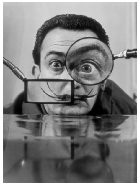
Дали, изучающий анонимуса, попавшегося за ежедневной мастурбацией, посредством лупы, усов и выпученных глаз

При любом удобном случае Дали безбожно врал, подставлял соучастников своих проделок, использовал тактику «Kick and Run», канючил, прикидывался дураком, пользовался либеральностью отца и добротой матери... В общем, редкостный мелкий пакостник. Считал, что весь мир вращается вокруг него и тайны реинкарнации его мертворождённого брата. Даже из католического колледжа, в