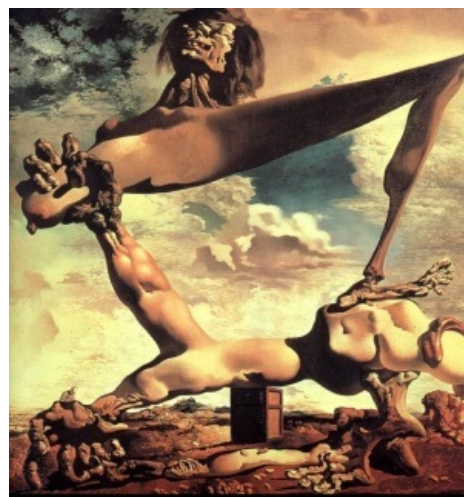
Мягкая конструкция с варёными бобами