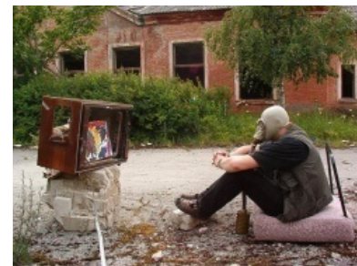
Пиздаускас выщипал брови