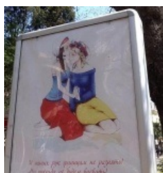
Нетрадиционные сексуальные отношения

Боевая часть переворота пришлась на неудобный момент — недалеко от Украины, в Сочи, принимали Олимпиаду. По негласным нормам в это время было не комильфо бряцать оружием и захватывать государства. При этом пара украинских спортсменов в знак солидарности с Майданом (а также по причине бесперспективности) снялись с соревнований. Посему похода на Украину не случилось — власти РФ позволили себе только «внезапную проверку боеготовности» войск Западного и Центрального ВО, которая прошла аккуратно между Олимпиадой и Паралимпиадой.