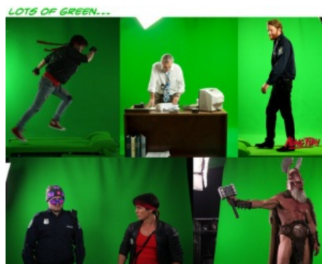
Много чего на зелёном снимали