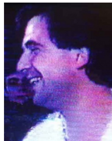
Вот он, этот тип гражданской наружности