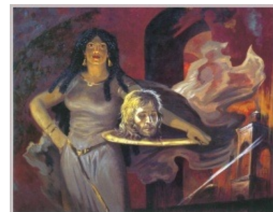
Смелые фантазии на тему